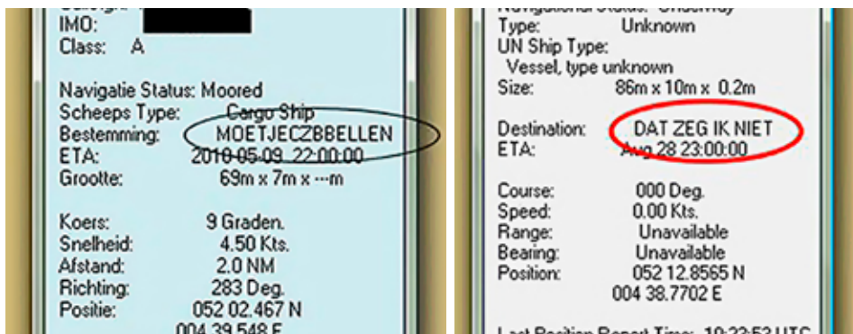
Voorbeelden van niet-toegelaten informatie over een bestemming. 2

Reisgelateerde informatie is informatie die te maken heeft met de route van een schip. Het gaat onder meer om de bestemming 1 , huidige diepgang en classificatie van gevaarlijke lading (blauwe kegels). Als een schip in een combinatie vaart, is ook de volgende informatie vereist: